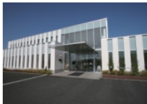
御所見総合クリニック

しかし、これらのうち真理の探究には興味を抱き、未知なことを見出す楽しさを経験した。 さて、このたび、当法人の経営をおおせつかったが、その方針は創設者の「創立の理念」に基づくことは当然である。目前には難題山積だが一つ一つ乗り越えて行くしかないと思う。 良悪は別にして、わが国における医療は統制経済下の統制医療であり、制約される面が多い。 それにしても医療にたずさわる人間は可能な限り「心に富を積む」ように心がけたいものである。病院とは英語でホスピタルだが、ホスピタリティ・すなわち、客をモテナスの意味に近いと云えよう。