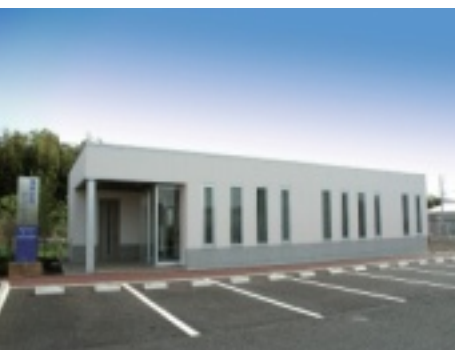
磯貝記念クリニック

一般通念のオモテナシほどのことは必要ないが、患者さんの苦痛や不安を取り除き、健康な日々を過ごせるようにすることは、正に、善なる行為と思われる。 ところで、人生には栄枯盛衰があるが、加齢（老化）という止めようのない変化も来る。わが国でも、今や、老年病科は内科に包含されてしまった。高齢者は種々なる病気を併せもっており、総合診療科が必要な時代となった。病院経営も世の変化に対応しつつ、善なる仕事求められるが、苦難が多い。 藤沢御所見病院は35年の歴史があり、新しい施設、高性能な新しい医療機器も備えている。加えて、活性ある職員により、より良い医療を世に提供し続けます。